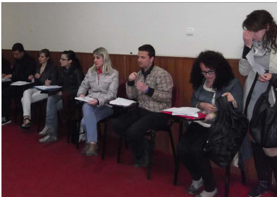
Në foto (lart): Grupi i Monitorimit gjatë monitorimit të Këshillit Bashkiak, Pogradec dhe trajnimeve Në fotot (poshtë): Grupi i Monitorimit gjatë trajnimeve për buxhetimin me pjesëmarrje

Ngri zërin dhe mos hiq dorë, mos u dorëzo, ....edhe nëse je i vetëm!