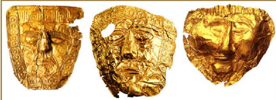
ЗЛАТНИ ПОГРЕБНИ МАСКИ ОД ТРЕБЕНИШТЕ