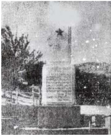
Lapidari në Pleshisht kushtuar ngritjes së Çetës