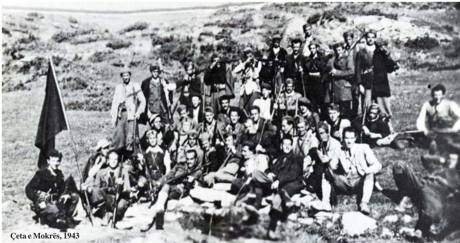
Çeta e Mokrës, 1943