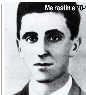
Me rastin e 70-vjetorit të krijimit të Çetës partizane të Mokrës (mars 1943- 2013)