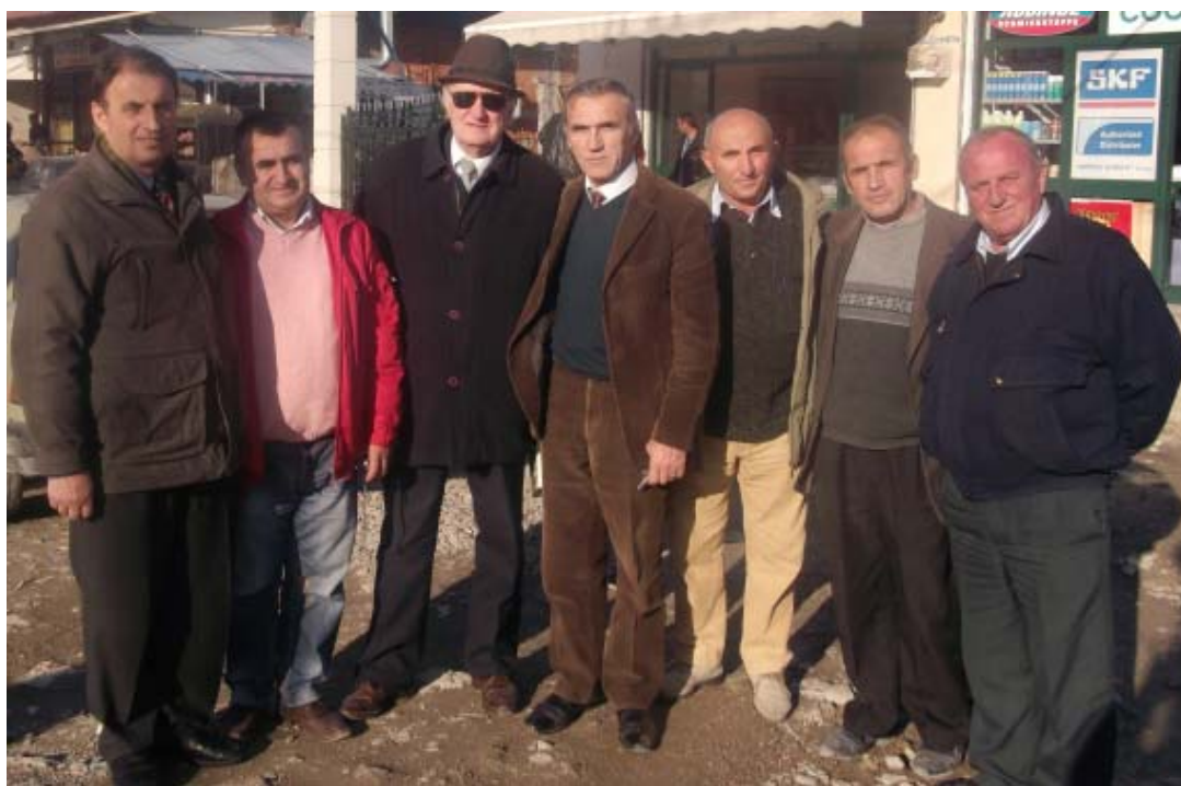
Redaksia e Gazetës “Mokra” në takimin vjetor me rastin e Vitit të Ri!