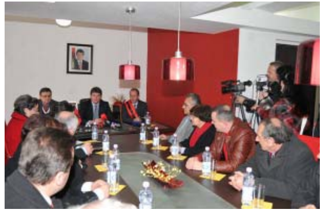
PRESIDENTI BAMIR TOPI VIZITON POGRADECIN!