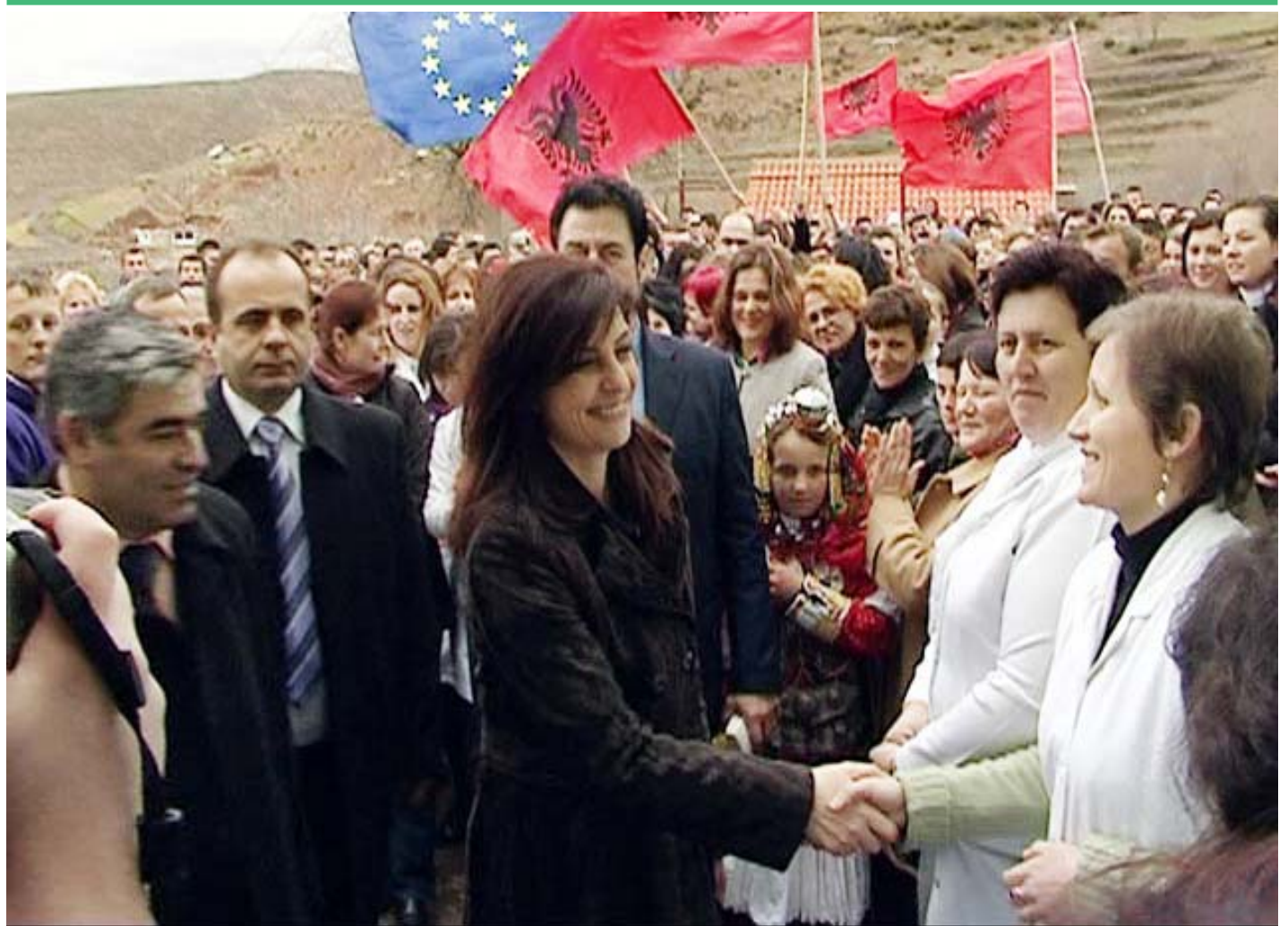
KRYEPARLAMENTARJA JOZEFINA TOPALLI TAKON DHE URON NXËNËSIT E MËSUESIT E SHKOLLËS SË RRAJCËS, ME RASTIN E 7 MARSIT, FESTËS SË MËSUESIT