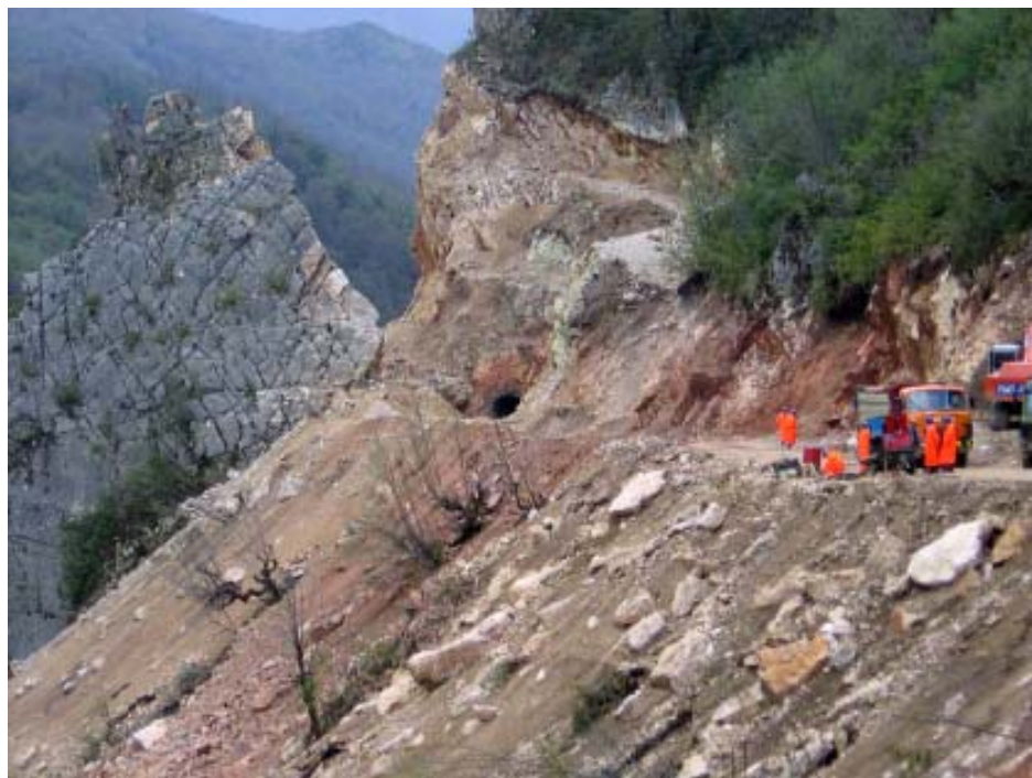
Nga ndërtimi i hidrocentralit te Slabinjës