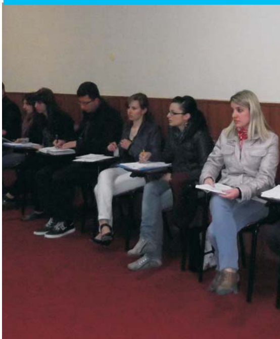
FOTO NGA MONITORIMI I KËSHILLIT TË BASHKISË

ZGJIDHNI QUITZ NË FAQEN 11 DHE MERRNI NJË DHURATË NGA GRUPI MONITORUES